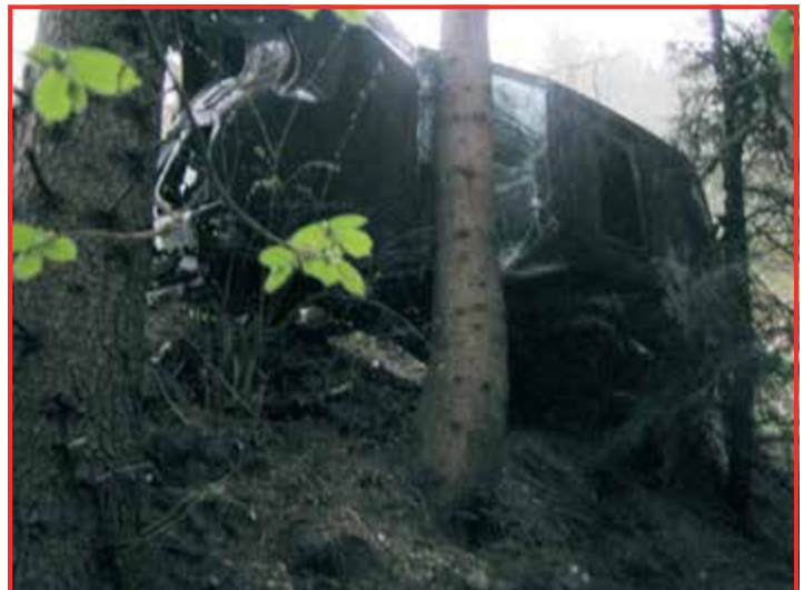
Verkehrsunfall am 1. Mai zwischen Großbreinprechts und Attenreith