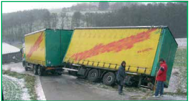
LKW Unfall beim Bauhof Lichtenau am 25. November 2013