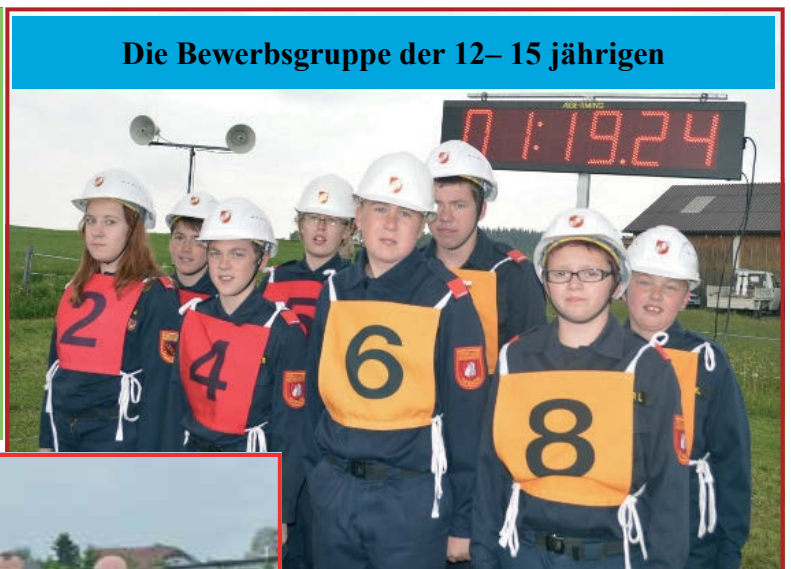
Die Wettbewerbsgruppe der 12- 15 jährigen