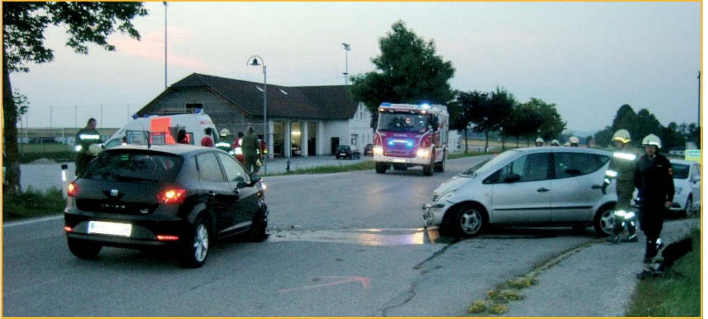
Verkehrsunfall am 19. Juli 2013 Kreuzung beim Feuerwehrhaus