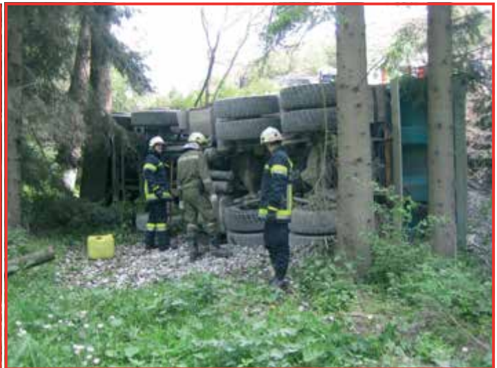
Verkehrsunfall am 16. Mai im Steinbruch Brunn am Walde