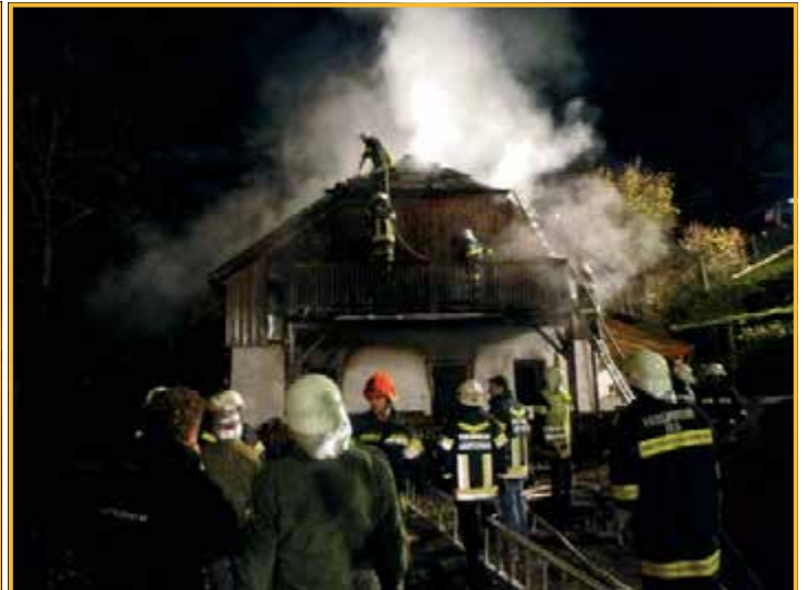
Brand am 26. Oktober 2013 in Gillaus