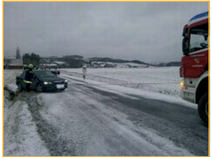
Fahrzeugbergung bei Reitern

Auch 2013 hatte die Feuerwehr Lichtenau wieder eine Vielzahl von Einsätzen zu bewältigen. Nicht weniger als 54 mal mussten die Mitglieder der Feuerwehr Lichtenau ausrücken, um Menschen in ihrer Notlage zu helfen, wobei dieses Jahr die große Vielfalt der verschiedenen Einsätze zu erwähnen ist: Verschmutzte Straßen, verstopfte Kanäle, Wasserversorgungen, Verkehrsunfälle, Brände bis hin zu den Katastropheneinsätzen im „Spitzergraben“ und beim Donauhochwasser stellten große Anforderungen an unsere Feuerwehrmitglieder.