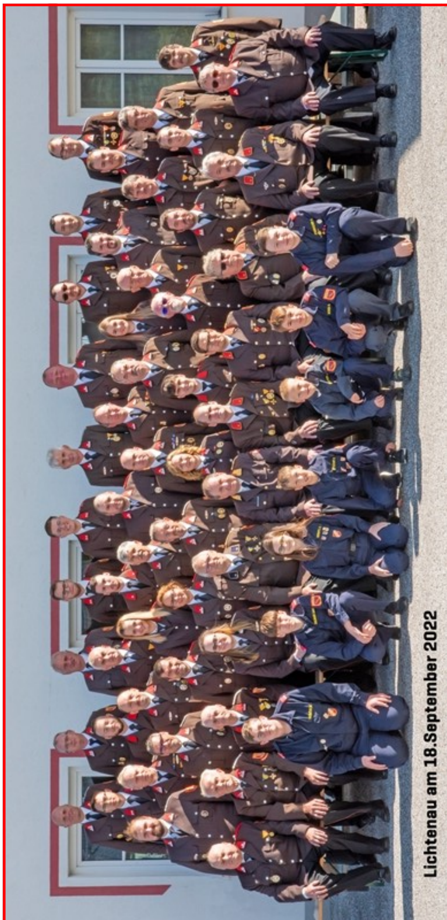
Lichtenau am 18. September 2022